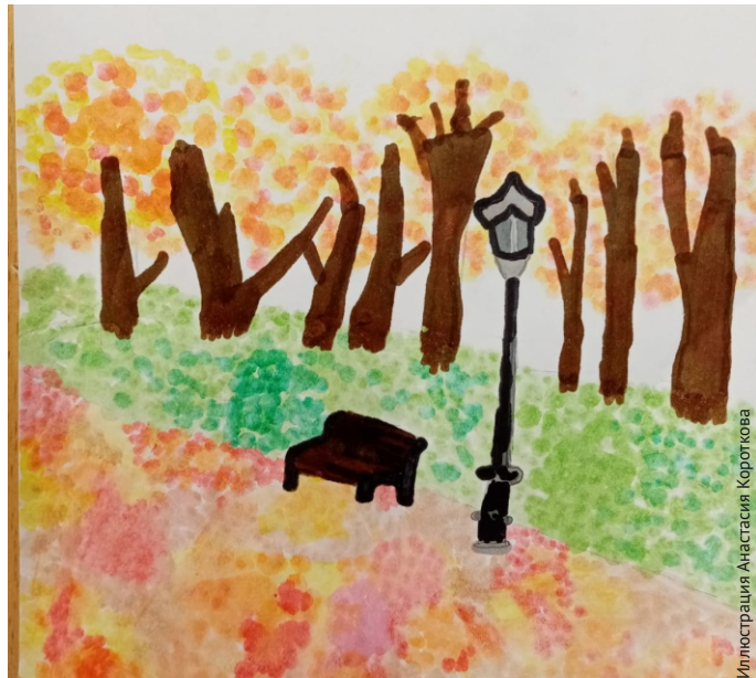
Иллюстрация Анастасия Короткова