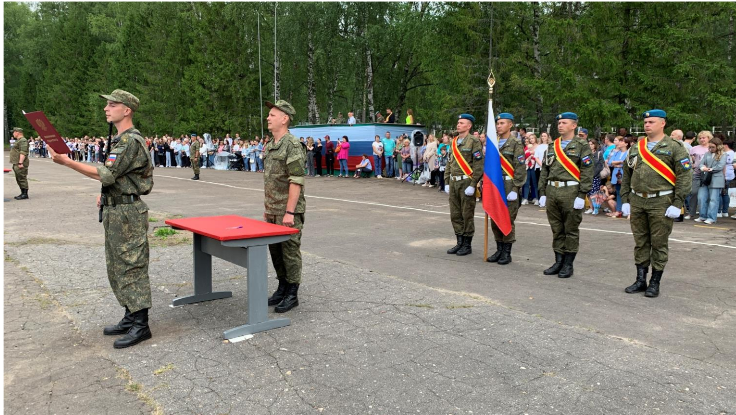
Приведение курсантов ВУЦ к Военной присяге