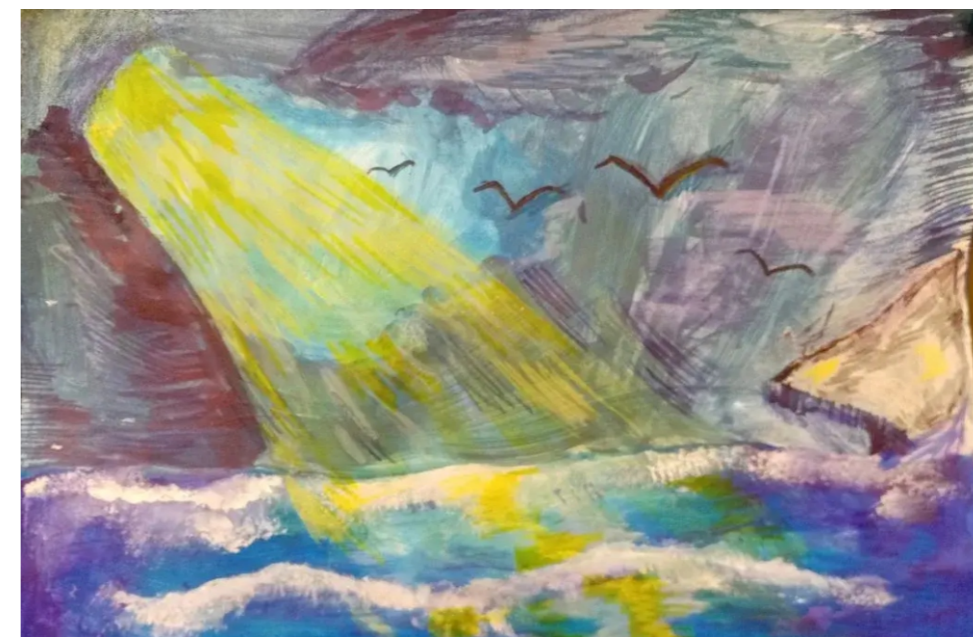
«Стихия» Иллюстрация Анастасии Тихобаевой