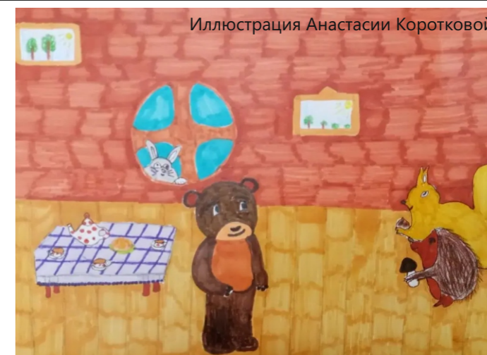
Иллюстрация Анастасии Коротковой

Пушистик почувствовал, как ему стало стыдно. Он никогда не думал, что его равнодушие может кого-то обидеть. Заяц опустил голову и тихо произнес: